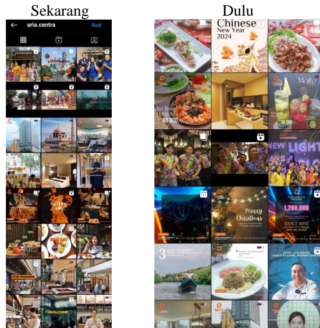
Gambar 2 Perbandingan Isi Feeds Konten Akun Instagram Hotel Aria Centra Surabaya

Sumber Gambar: Instagram Hotel Aria Centra 2024