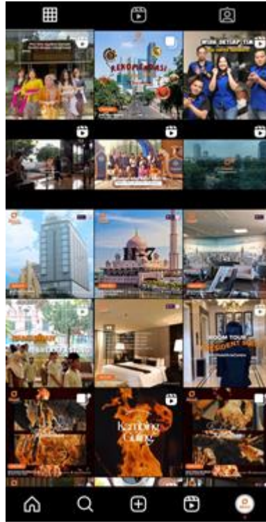
Gambar 2 Isi Feeds Konten Akun Instagram Hotel Aria Centra Surabaya

yang pertama yaitu ; Sebagai salah satu tempat untuk memberikan Informasi dan memasarkan produk yang dimiliki seperti fasilitas lengkap yang diberikan, berbagai macam menu makanan yang tersedia dan konten-konten menarik lainnya yang ada hubungannya dengan Hotel Aria Centra Surabaya. (Gambar 2)