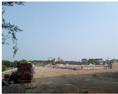
Gambar 4.6 Perbaikan Tempat Parkir

“kalau untuk fasilitas kita mulai bangun spot – spot foto atau penambahan spot – spot foto, ada juga sarana dan prasarana penunjang untuk wisata misalnya di tahun 2021 kita juga melakukan pembenahan – pembenahan selama kita lockdown, jadi kalau sudah buka kita tu lebih siap kedepannya dan lebih ada kemajuan nanti pengunjung juga bilang oh ternyata setelah pandemi kita ke sini lagi sudah beda ya, jalannya sudah di bangun, terus sudah ada stand makan dan minunya jadi orang ke sini tu sudah rubah apalagi kan stand makan minum itu sebelumnya kan tidak ada mbak, itu dibangun waktu 2022 setelah pasca pandemi jadi itu termasuk peran kita untuk menarik para pengunjung jadi kan sebelum pandemi kan belum ada, jadi setelah pandemi sudah ada. Ada juga fasilitas yang saat ini Dinas Pariwisata dan juga Pengelola Mangrove masih dalam proses perbaikan yaitu tempat parkir sama jembatan yang menghubungkan antara Mangrove Gunung Anyar sama Medokan Ayu.” (wawancara : 02 Mei 2023)