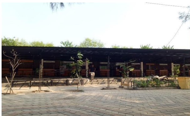
Gambar 4.10 Stand Makan Minum Dinas Cipta Karya

“Untuk keterlibatan swasta ada mbak seperti JSAR. Jadi ada bantuan nanti kayak bantuan bibit Mangrove terus ada ATP bantuannya itu kayak wahana. Yang paling banyak si bibit mbak, karena disinikan masih ada tanahnya orang masih milik pribadi itu dalam bentuk tambak. Jadi akhirnya di beli oleh pemkot surabaya untuk kita kembalikan lagi menjadi hutan. Nah itu termasuk bibitnya ada yang dari JSAR, dari universitas, komunitas, bantuan bibit untuk mengendalikan lagi tambaknya yang dari milik pribadi warga setempat dibeli pemkot dijadikan hutan.” (wawancara : 03 Mei 2023)