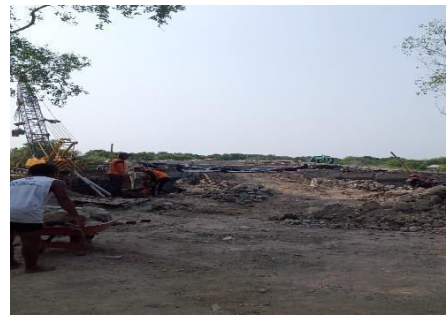
Gambar 4.7 Pembangunan Jembatan