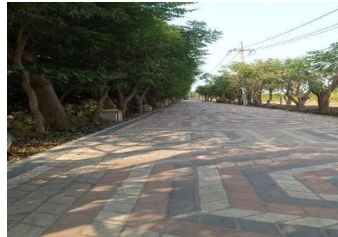
Gambar 4.9 Kondisi Setelah Perbaikan