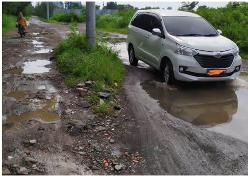
Gambar 4.8 Kondisi Sebelum Perbaikan