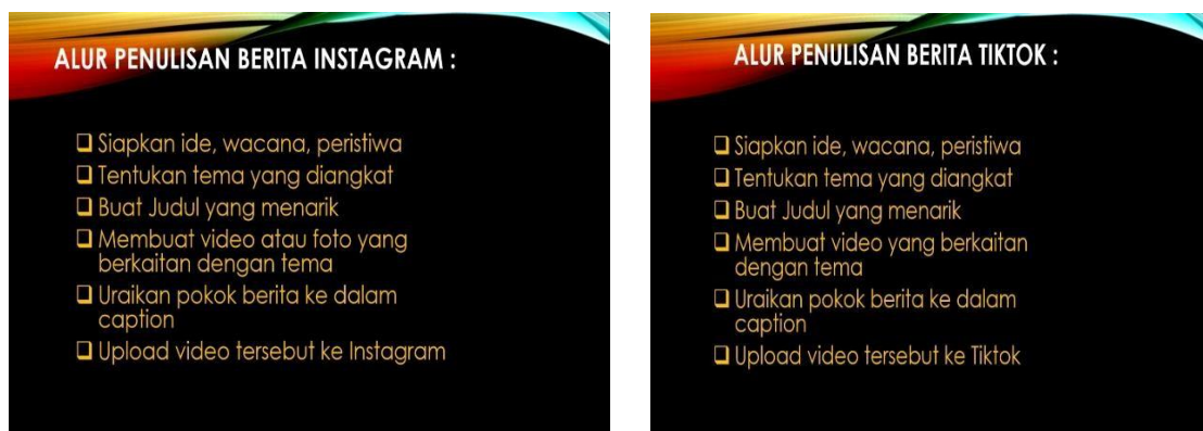
Gambar 2 & 3; Alur Penulisan; Proses penulisan berita sosial media Sumber; Olahan tim pengabdian

Pada alur penulisan berita dalam media sosial yaitu memiliki kesamaan diantaranya sama-sama menyiapkan sebuah ide dalam pembuatan berita. Instagram dan Tiktok sebagai media massa yang biasa digunakan banyak masyarakat untuk memposting berbagai macam berita terbaru atau viral. Media sosial Instagram dan Tiktok mempermudah pengguna untuk mengakses berbagai informasi terbaru. Untuk penulisan ide sebuah berita di media massa ini diperlukan momen atau topik yang lagi viral di Indonesia. Salah satu contoh permasalahan ide sebuah konten media massa yaitu wisata dan kuliner, sebagai tema dari media massa ini wisata dan kuliner sangat diminati berbagai kalangan masyarakat khususnya masyarakat luar Desa Bolo. Maka dari itu, Desa Bolo perlu media massa promosi agar dapat dikenal masyarakat luar yang belum mengetahui keunggulan Desa Bolo, dan juga dapat membantu UMKM di Desa Bolo dikenal masyarakat luar, selain itu dapat diminati oleh banyak kalangan baik usia remaja hingga dewasa.