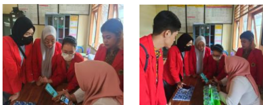
Gambar 4 & 5 : Kegiatan penyuluhan dengan admin media sosial desa

Pada tahap pelaksanaan, dilakukan di Desa Bolo, Kecamatan Kare, Kabupaten Madiun dengan menjelaskan tentang cara pelatihan dan penggunaan media sosial dan website desa. Tim pengabdian mendiskusikan dengan pemerintah Desa Bolo tentang cara menggunakan website dan media sosial untuk meningkatkan informasi dan transparansi Desa Bolo.