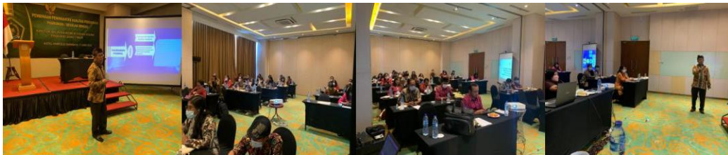
Gambar 2: Paparan Materi oleh Pengabdian

Pelatihan Tata Kelola Kemandirian Pasraman yang diselenggarakan di Hotel Fairfield by Marriot Surabaya, hari Sabtu, 11 Juni 2022 ini diikuti oleh 35 orang terdiri dari Guru dan pengelola pasraman dari Surabaya, Sidoarjo, Gresik dan Mojokerto