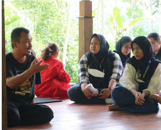
Gambar 4. Antusiasme Peserta Pelatihan Dalam Diskusi Yang Berlangsung

lokal setempat, kemudian mengenalkan produk kopi unggulan, sampai pada pengenalan terhadap UMKM berupa kerajinan tangan maupun kuliner setempat.