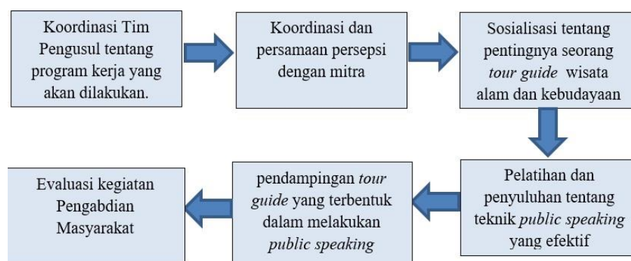
Gambar 1. Peta pelaksanaan program

Pada tahap ini pengusul akan bertindak sebagai pendamping dalam memonitor praktek lapangan dalam mengaplikasikan konsep dan teori yang diberikan pada saat penyuluhan dan pelatihan sebelumnya. Pendamping juga diikuti dengan evaluasi yang merujuk pada perkembangan yang dialami mitra dari awal praktek hingga pada pencapaian yang dianggap berhasil melalui indikator yang telah ditentukan.