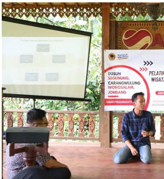
Gambar 3. Pemaparan Materi Dari Tim Pengabdian

Kebanyakan peserta dan masyarakat setempat tidak terlalu menganggap penting seorang tour guide karena selama ini pengelola wisata Kampung Adat Segunung melakukan pendampingan terhadap wisatawan yang ada berbasis ala kadarnya saja dan tidak dilakukan melalui struktur pengelola wisata yang jelas, sehingga pelayanan terhadap para wisatawan yang datang masih belum optimal.