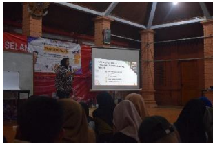
Gambar 6. Pembukaan penyuluhan