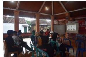
Gambar 17. Audience memperhatikan materi

Pada kegiatan ini Tim PPK ORMAWA BEM FISIP Universitas Agustus 1945 Surabaya melakukan forum pendampingan alur penjualan secara online di marketplace Shopee yang langsung diberikan pengarahannya secara daring melalui zoom oleh pihak Shopee guna memberikan pengarahannya bagaimana alur penjualan produk usaha secara online melalui marketplace Shopee.