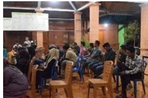
Gambar 2. Peserta Penyuluhan

Pada kegiatan ini Tim PPK ORMAWA BEM FISIP Universitas Agustus 1945 Surabaya menyelenggarakan sosialisasi pengarahan perbedaan antara Branding dan Marketing yang bertujuan untuk memperluas wawasan para UMKM Desa Bejijong dalam memahami peranan Branding dan Marketing.