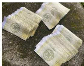
Gambar 13. Label untuk UMKM Kaos