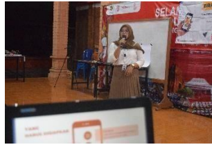
Gambar 7. Pemaparan materi manajemen sosial