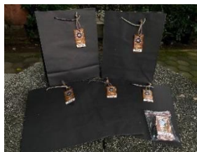
Gambar 10. Packaging UMKM Batik