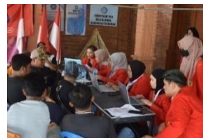
Gambar 19. Tim PPK ORMAWA membantu mendaftarkan NIB