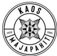
Gambar 9. Logo UMKM kaos majapahit