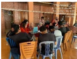
Gambar 18. Antusias warga mendaftarkan NIB