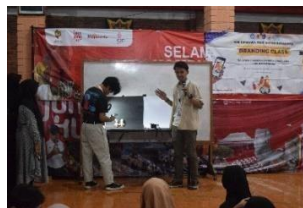
Gambar 4. Pemaparan materi foto produk