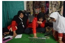
Gambar 22. Pemaparan materi laporan laba usaha Batik