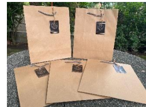
Gambar 11. Packaging UMKM Kaos