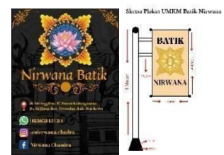
Gambar 14. Design Plakat usaha

Pada kegiatan ini Tim PPK ORMAWA BEM FISIP Universitas Agustus 1945 Surabaya membantu 2 UMKM pilihan yang berada di Desa Bejijong, yakni UMKM Kaos Majapahit dan UMKM Batik Nirwana dalam pembuatan Desain Logo Usaha, Packaging, katalog, Label, dan Plakat usaha.