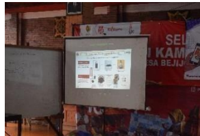
Gambar 16. Pemaparan materi shopee