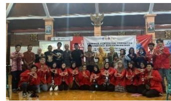
Gambar 20. Sesi foto bersama DISPERINDAG

Pada kegiatan ini Tim PPK ORMAWA BEM FISIP Universitas Agustus 1945 Surabaya melakukan kegiatan sosialisasi serta membuka pendaftaran NPWP dan NIB secara gratis untuk UMKM Desa Bejijong. Materi pada saat sosialisasi diberikan secara langsung oleh Dinas Perindustrian dan Perdagangan Kota Mojokerto dan pendaftaran NPWP serta NIB dibantu oleh Tim PPK ORMAWA BEM FISIP Universitas Agustus 1945 Surabaya. Dalam kegiatan ini Tim PPK ORMAWA BEM FISIP Universitas Agustus 1945 Surabaya yang juga telah berhasil mendaftarkan kurang lebih 50% dari target awal.