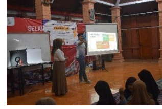
Gambar 8. Materi Manajemen sosial media usaha

Pada kegiatan ini Tim PPK ORMAWA BEM FISIP Universitas Agustus 1945 Surabaya mengadakan forum pendampingan manajemen sosial media usaha yang bertujuan untuk memberi pengarahan serta contoh bagaimana mengelolah atau memajemen sosial media usaha yang baik dan menarik agar dapat menarik pelanggan.