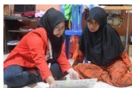
Gambar 21. Pemaparan materi laporan laba usaha Kaos