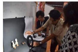
Gambar 5. Praktek foto Produk

Pada kegiatan ini Tim PPK ORMAWA BEM FISIP Universitas Agustus 1945 Surabaya mengadakan forum pendampingan tata cara foto produk yang bertujuan untuk melatih dan memberi wawasan pada para UMKM Desa Bejijong agar dapat melakukan pengambilan gambar produk usaha mereka secara mandiri dengan hasil yang maksimal sehingga ketika gambar produk diunggah pada sosial media atau platform jual beli onlinedapat lebih menarik pelanggan.