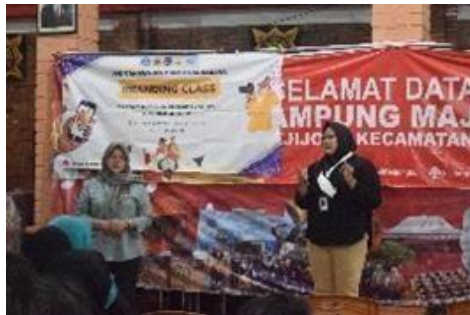
Gambar 1. Penyampaian materi