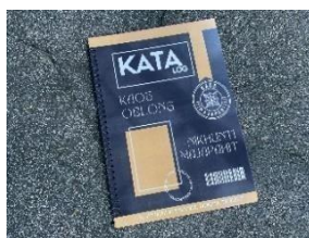
Gambar 12. Katalog UMKM Kaos