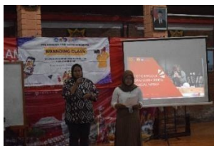
Gambar 3. perkenalan materi foto produk