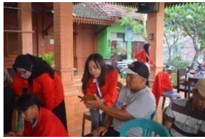
Gambar 15. Pendampingan alur pendaftaran shopee