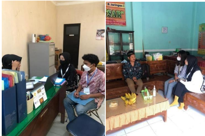
Gambar 1: Koordinasi Program Kejar Paket dengan Dinas Pendidikan

Kegiatan selanjutnya ialah tim pengabdian melakukan persiapan untuk mencari data bagi warga Desa Bejjong yang ingin mengikuti program kejar paket. Dalam hal ini kami melakukan blusukan (kunjungan) melalui ketua RT dan RW yang berada di Dusun Kedungwulan dan Dusun Bejjong. Kami di terima secara baik oleh warga Desa Bejjong dan memperoleh kurang lebih 6 anak yang mengikuti program kejar paket. Untuk mengikuti program ini sendiri ada beberapa syarat berkas yang dibutuhkan diantaranya fotokopi akta kelahiran, fotokopi kartu keluarga, dan pas foto dengan menggunakan kemeja putih berlatar belakang baground merah. Selanjutnya ialah mengisi formulir pendaftaran dan menyerahkan berbagai berkas yang sudah dicantumkan diatas ke pihak PKBM Bina Insani Firaas.