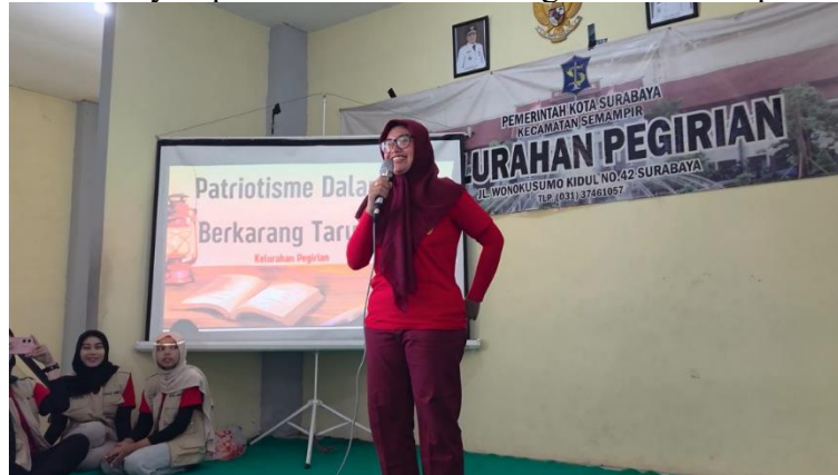
Gambar 1. Penyampaian Materi Ke-Karang Taruna-an kepada Peserta

Gambar 1 menunjukkan proses penyampaian materi sebagai bagian dari transfer pengetahuan kepada peserta. Dokumentasi ini relevan karena memperlihatkan tahap edukasi yang menjadi dasar bagi peserta sebelum masuk ke sesi diskusi dan jaring aspirasi. Pada tahap ini, peserta diarahkan untuk memahami kembali fungsi Karang Taruna sebagai wadah pengembangan generasi muda, kepedulian sosial, dan partisipasi masyarakat.