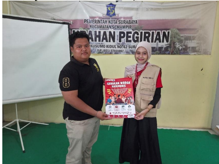
Gambar 4. Penyerahan Poster Edukasi kepada Perwakilan Rukun Warga

Gambar 4 menunjukkan salah satu luaran kegiatan berupa penyerahan poster edukasi. Poster tersebut berfungsi sebagai media komunikasi visual yang mendukung keberlanjutan pesan kegiatan setelah sosialisasi selesai. Dengan adanya poster, pesan mengenai kerukunan sosial, partisipasi pemuda, dan penguatan Karang Taruna dapat tetap terlihat oleh masyarakat.