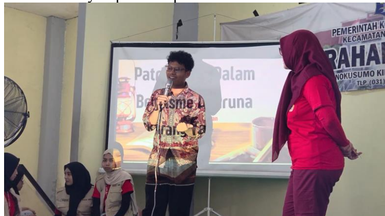
Gambar 2. Penyampaian Aspirasi Lisan oleh Perwakilan Peserta

Salah satu bagian penting dalam kegiatan ini adalah sesi penyampaian aspirasi lisan oleh perwakilan peserta. Pada sesi tersebut, salah satu peserta maju untuk menyampaikan keluhan, pengalaman, dan harapan terhadap Karang Taruna. Penyampaian ini menunjukkan bahwa peserta memiliki kesadaran terhadap permasalahan organisasi, khususnya terkait kebutuhan peningkatan keaktifan anggota, koordinasi yang lebih baik, serta kejelasan arah kegiatan. Sesi ini menjadi bukti bahwa kegiatan tidak hanya berlangsung sebagai komunikasi satu arah dari narasumber kepada peserta, tetapi juga membuka ruang dialog bagi peserta untuk menyampaikan kondisi nyata yang mereka alami.