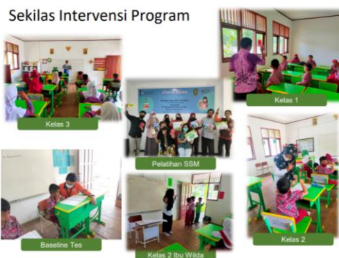
Gambar 1. Dokumentasi Pelaksanaan Program CSR “Saya Suka Membaca” di Sekolah Dasar Kecamatan Kaliorang