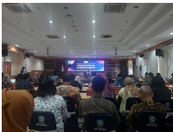
Gambar 1: Mengikuti Rapat koordinasi PPID “Pemetaan Usulan PPID Pelaksana Atas Informasi Yang Dikecualikan”

Kelolaan informasi publik dilakukan dan dijalankan oleh Pejabat Pengelola Informasi dan Dokumentasi (PPID). Tugas PPID mencakup penyimpanan, pendokumentasian, penyediaan, dan/atau pelayanan informasi public. PPID memiliki peran penting dalam memastikan transparansi pemerintahan dengan menyediakan akses yang mudah terhadap informasi publik. Mereka harus mematuhi peraturan dan undang-undang yang berlaku yang berkaitan dengan hak akses informasi publik saat bekerja. Prinsip keterbukaan pemerintah adalah kunci dalam menjalankan tugas PPID. Ini mengharuskan mereka untuk memberikan informasi yang diperlukan oleh public, kecuali jika ada alasan hukum yang sah untuk tidak melakukannya (Timur Bayu Setiawan, 2024).