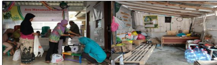
Gambar 4 Penyerahan Timbangan dan Layout Bank Sampah

Pengadaan prasarana pada kegiatan pengabdian ini berupa pengadaan tempat menata sampah setelah dipilah berdasarkan jenisnya.