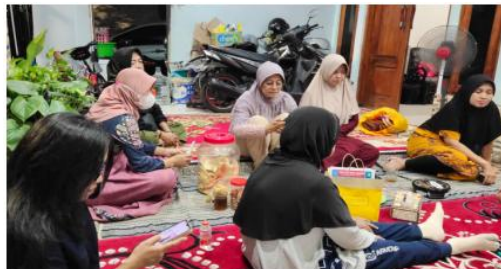
Gambar 5 Penyuluhan Penanganan dan Pemanfaatan sampah