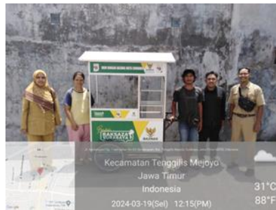
Gambar 2. Penyerahan Bantuan Rombong Ke Masyarakat yang terkategori ke dalam data GAMIS

Penyelenggaraan pemutakhiran data Keluarga Miskin merupakan suatu tahapan dimana proses pemutakhiran data ini dilakukan setiap bulan untuk mengetahui bagaimana perkembangan masyarakat yang sudah mendapatkan intervensi dari pemerintah kota Surabaya, data kemiskinan memang sudah seharusnya bergerak dan dinamis oleh dalam hal ini apakah pelaksanaan program pemerintah kota Surabaya sudah berjalan dengan efektif dan efisien, namun dalam pelaksanaan pemutakhiran data gamis tersebut masih sering mengalami beberapa permasalahan yang harus di selesaikan. Berikut Adapun sifat permasalahan dalam pemutakhiran data keluarga miskin di tempat magang kantor Kecamatan Tenggilis Mejoyo dapat digambarkan sebagai berikut: