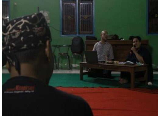
Gambar kegiatan 4