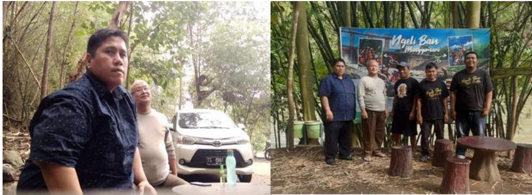
Gambar kegiatan 1

penugasan nomor: 676/ST/003/LPPM/AbdimasVIII/2022. maka ditindaklanjuti dengan melakukan koordinasi tim pelaksana tentang rencana kegiatan yang akan dilakukan, menentukan tahapan pelaksanaan kegiatan.