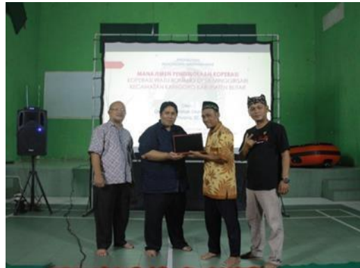
Gambar kegiatan 2