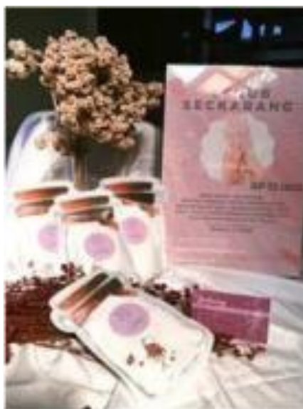
Gambar 1. Produk Body Scrub Bunga Telang (SECKARANG)