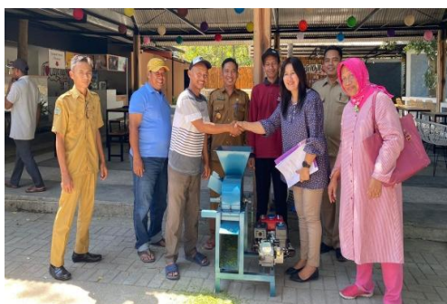
Gambar 8: Serah terima mesin kompos