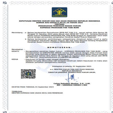
Gambar 6: Dokumen Badan Hukum