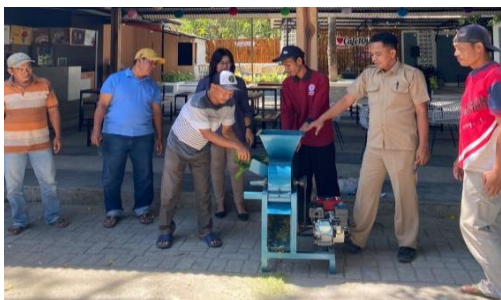
Gambar 9: Latihan Penggunaan Mesin