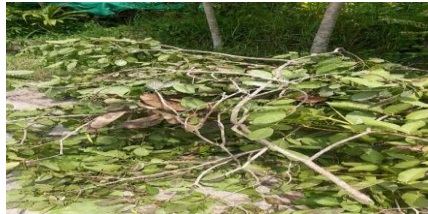
Gambar 2: Sampah bahan kompos