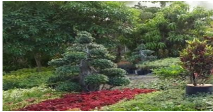
Gambar 1: Contoh Tanaman Hias