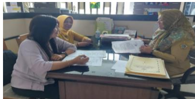
Gambar 4: Koordinasi dengan Dinas Koperasi Kabupaten Gresik