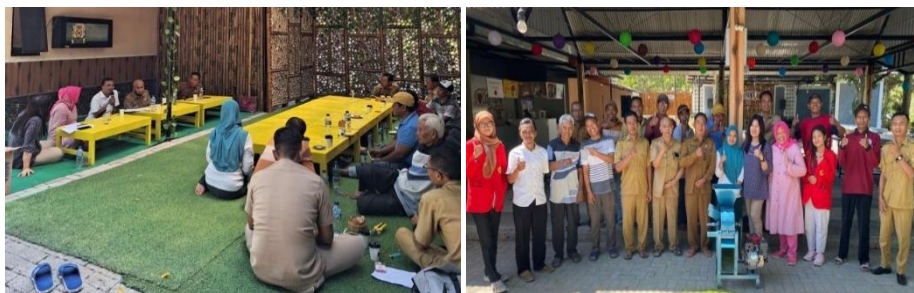
Gambar 5: Pertemuan pihak terkait dalam berbagai kegiatan