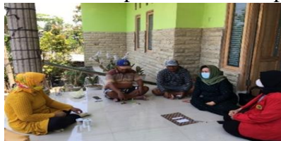
Gambar 3: Pertemuan dengan Ketua dan Sekrearis paguyuban Rencana pembentukan Koperasi