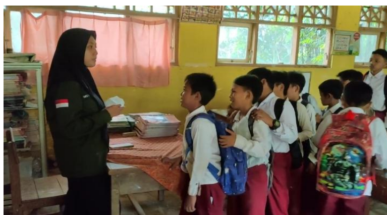
Gambar 8. Penerapan Kereta Numerasi

Dikarenakan tidak ada kegiatan yang dapat meningkatkan kemampuan numerasi siswa di sekolah, maka mahasiswa kampus mengajar menerapkan kereta numerasi. Kereta numerasi dilakukan 15 menit sebelum pulang sekolah dengan meminta siswa untuk berbaris seperti kereta dan mereka akan ditanyai tentang penjumlahan atau pengurangan bagi kelas 1-3 dan perkalian atau pembagian bagi kelas 4-6. Jika tidak bisa menjawab atau salah menjawab, maka harus antri lagi ke barisan paling belakang dan jika menjawab benar, maka bisa langsung pulang.