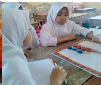
Gambar 7. Penerapan PAKOIBILBUL

Dikarenakan tidak ada kegiatan yang dapat meningkatkan kemampuan numerasi siswa di sekolah, maka mahasiswa kampus mengajar menerapkan kereta numerasi. Kereta numerasi dilakukan 15 menit sebelum pulang sekolah dengan meminta siswa untuk berbaris seperti kereta dan mereka akan ditanyai tentang penjumlahan atau pengurangan bagi kelas 1-3 dan perkalian atau pembagian bagi kelas 4-6. Jika tidak bisa menjawab atau salah menjawab, maka harus antri lagi ke barisan paling belakang dan jika menjawab benar, maka bisa langsung pulang.