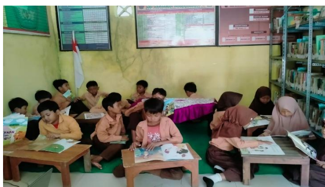
Gambar 3. Kegiatan Membaca di Perpustakaan

Dalam menumbuhkan minat baca, mahasiswa menggunakan perpustakaan ini untuk mengajak siswa secara bergantian membaca buku di perpustakaan. Kegiatan ini menggunakan metode “One Day One Class” dan dilakukan setelah jam istirahat sampai jam pulang sekolah. Tetapi sebelum kegiatan ini dimulai, mahasiswa dari kampus mengajar 5 memberikan sosialisasi mengenai tujuan adanya perpustakaan dan peraturan yang harus ditaati jika berada di dalam perpustakaan. Perpustakaan SDN Kendaban 1 memiliki banyak buku penunjang pembelajaran dan buku cerita bergambar yang menarik sehingga membuat siswa sangat antusias untuk berkunjung ke perpustakaan. Siswa dapat memilih sendiri buku yang akan dibaca dan jika sudah selesai membaca bisa ditukarkan dengan buku lainnya. Kegiatan ini bertujuan agar siswa memiliki kebiasaan membaca sejak dini dan diharapkan mampu meningkatkan minat dan motivasi siswa untuk membaca setiap hari.