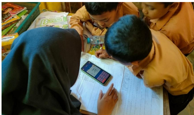
Gambar 9. Melatih penjumlahan dan pengurangan bersusun

matematika sambil bermain game membuat siswa sangat antusias untuk terus mencobanya. Kegiatan ini dapat juga dapat dikatakan sebagai salah satu adaptasi teknologi dalam proses pembelajaran. Model pembelajaran yang inovatif seperti ini diharapkan dapat diterapkan oleh guru ketika mengajar di kelas.