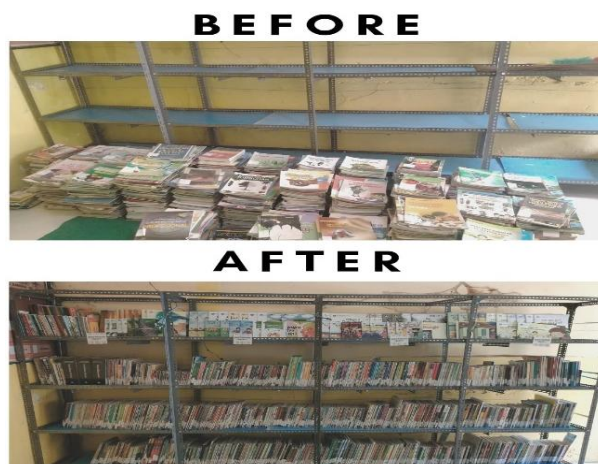
Gambar 2. Pemeliharaan dan Pengelolaan Perpustakaan

Dalam menumbuhkan minat baca, mahasiswa menggunakan perpustakaan ini untuk mengajak siswa secara bergantian membaca buku di perpustakaan. Kegiatan ini menggunakan metode “One Day One Class” dan dilakukan setelah jam istirahat sampai jam pulang sekolah. Tetapi sebelum kegiatan ini dimulai, mahasiswa dari kampus mengajar 5 memberikan sosialisasi mengenai tujuan adanya perpustakaan dan peraturan yang harus ditaati jika berada di dalam perpustakaan. Perpustakaan SDN Kendaban 1 memiliki banyak buku penunjang pembelajaran dan buku cerita bergambar yang menarik sehingga membuat siswa sangat antusias untuk berkunjung ke perpustakaan. Siswa dapat memilih sendiri buku yang akan dibaca dan jika sudah selesai membaca bisa ditukarkan dengan buku lainnya. Kegiatan ini bertujuan agar siswa memiliki kebiasaan membaca sejak dini dan diharapkan mampu meningkatkan minat dan motivasi siswa untuk membaca setiap hari.