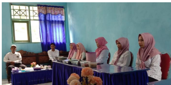
Gambar 1. Berkoordinasi dengan guru terkait program literasi dan numerasi

Melakukan diskusi dengan para guru tentang implementasi gerakan literasi dan numerasi yang telah dikembangkan dan dilaksanakan di sekolah. Dari hasil diskusi, diketahui bahwa di SDN Kendaban 1 belum ada kegiatan yang dapat meningkatkan kemampuan literasi dan numerasi siswa. Permasalahan terkait gerakan literasi dan numerasi yang dihadapi SDN Kendaban 1 antara lain: 1) Tidak ada ruang perpustakaan, 2) Kurangnya minat siswa dalam membaca, dan 3) Terbatasnya fasilitas yang dapat digunakan untuk kegiatan literasi dan numerasi.