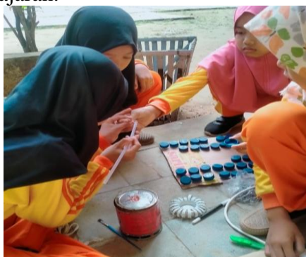
Gambar 6. Membuat PAKOIBILBUL

Bilangan Bulat (PAKOIBILBUL) dalam menjelaskan materi. Media pembelajaran manual ini diterapkan pada siswa kelas 4 dan 5. PAKOIBILBUL dibuat dan didesain sendiri oleh siswa menggunakan barang – barang bekas seperti, tutup botol, kardus bekas, plastik, paku, cat, dll. Dengan adanya media pembelajaran ini, diharapkan dapat langsung memberikan gambaran tentang operasi bilangan bulat dan siswa dapat belajar matematika dengan cara yang menyenangkan. Hal ini dapat ditunjukkan selama kegiatan pembelajaran siswa sangat bersemangat untuk memecahkan persoalan bilangan bulat dan dapat menerapkannya pada media pembelajaran.