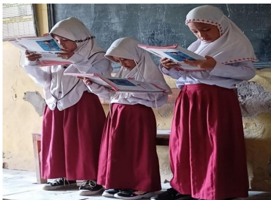
Gambar 4. Membaca Cerita Dialog di Depan Kelas

sekedar membaca tetapi juga belajar mengungkapkan dan memerankan karakter dari bacaan tersebut. Hal ini memberikan kesempatan kepada siswa untuk menjadi pendongeng, bukan hanya pendengar.